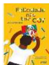
Felicidade não tem cor Júlio Emílio Braz – Ed. FTD

Um Livro será solicitado durante o ano letivo de 2024.